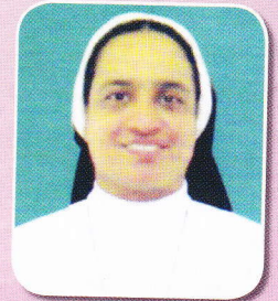
Sr. Dona CPS (Secretary)