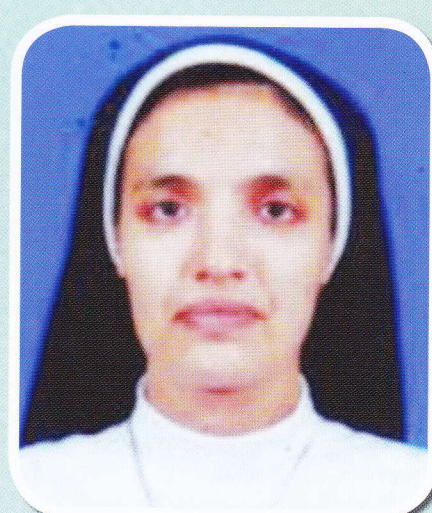
Sr. Fincy CMC Principal, Nursing School