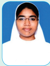
Sr. Tiny J Nursing